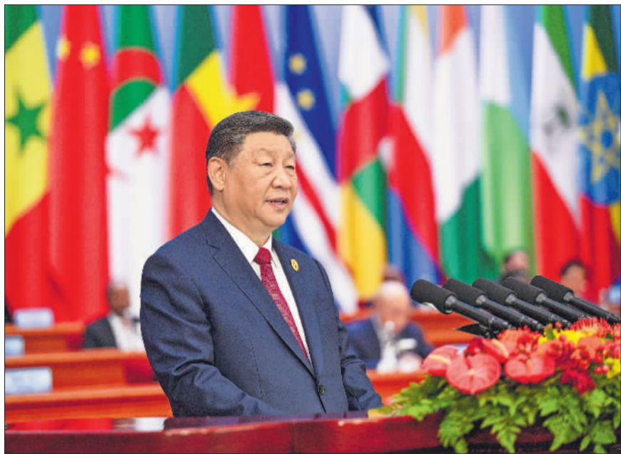
9月5日上午，国家主席习近平在北京人民大会堂出席中非合作论坛北京峰会开幕式并发表题为《携手推进现代化，共筑命运共同体》的主旨讲话。