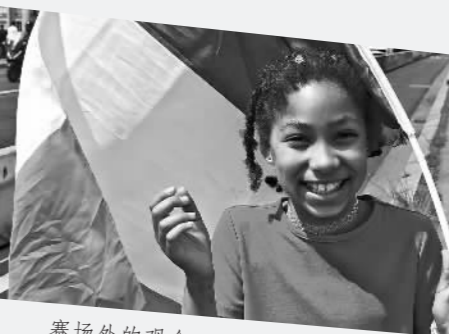
赛场外的观众。