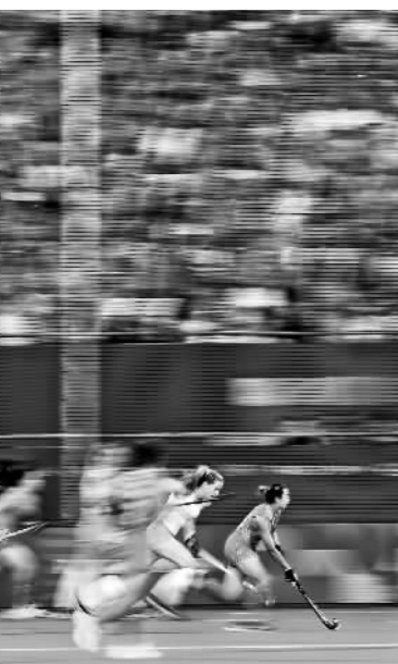
中国女子曲棍球队在与荷兰女子曲棍球队进行冠军赛。

从代表家乡四川达州参加比赛,到2012年入选四川女子曲棍球队,再到2018年获得全国锦标赛第一名,杨榴的成绩单不断刷新。2018年和2021年,杨榴连续两年入选国家队,成为国内最优秀的曲棍球运动员之一。