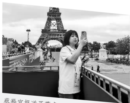
蔡矜宜报道开幕式。