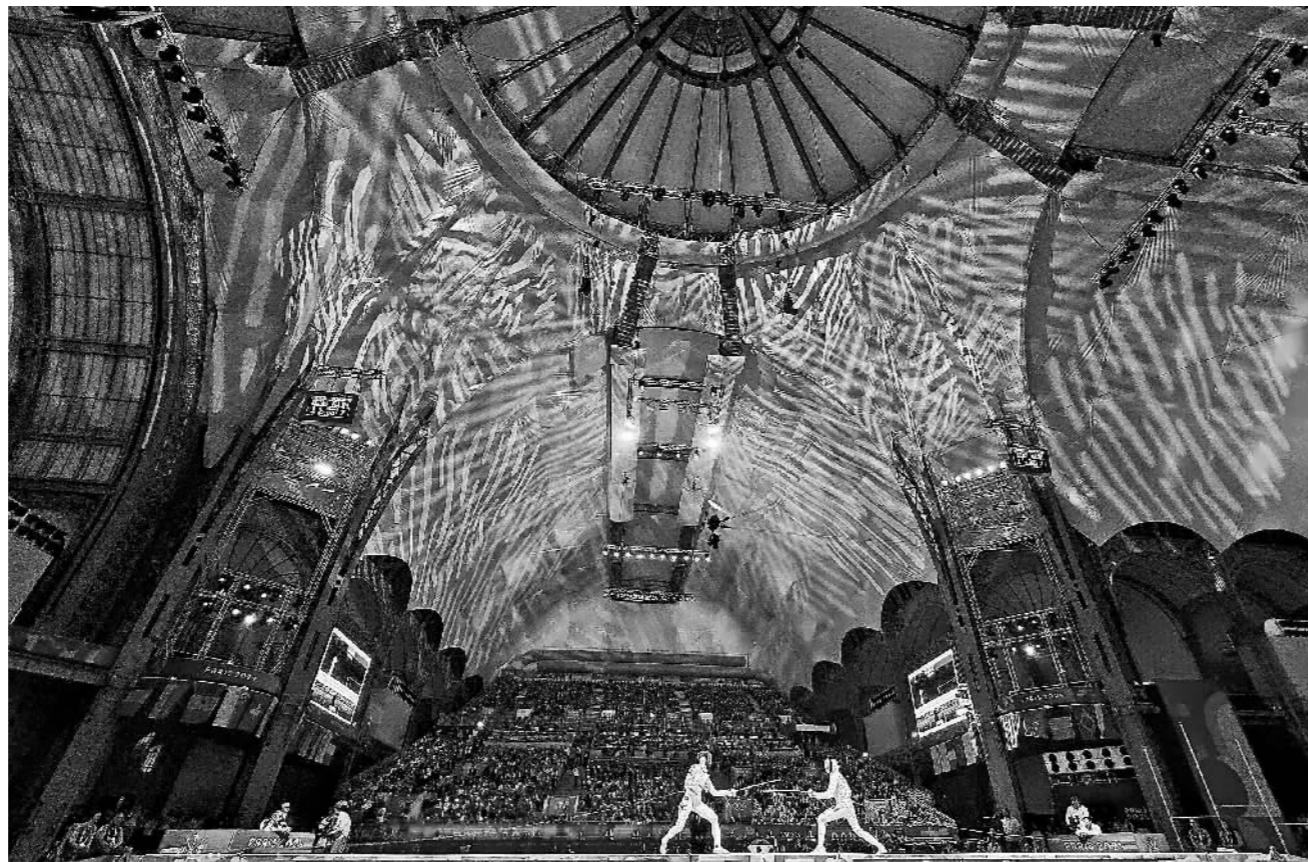
巴黎大皇宫举行的击剑比赛。

巴黎奥运会开赛,外界对中国女曲的期待并不高。小组赛第一场,中国队1比2惜败于比利时,第二场大胜日本,第三场又0比3负于世界排名第一