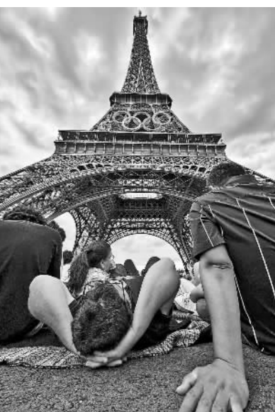
埃菲尔铁塔下休息的人。

这一刻,中国体育的成长实现接续。张虹曾在2014年索契冬奥会为中国速度滑冰夺得首枚冬奥金牌。2018年平昌冬奥会后,张虹当选国际奥委会委员,从此开始在国际组织中多次发出“中国声音”。今年年初举办的韩国江原道冬青奥会,张虹作为国际奥委会130年来最年轻的协调委员会主席,参与了赛事相关的多方沟通工作。