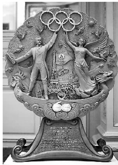
微缩版“同舟共渡”雕塑。

在刚刚结束的巴黎奥运会上,我们或是为运动员的精彩表现高声喝彩,或是为夺冠成功激动落泪,或是为失之交臂遗憾惋惜。