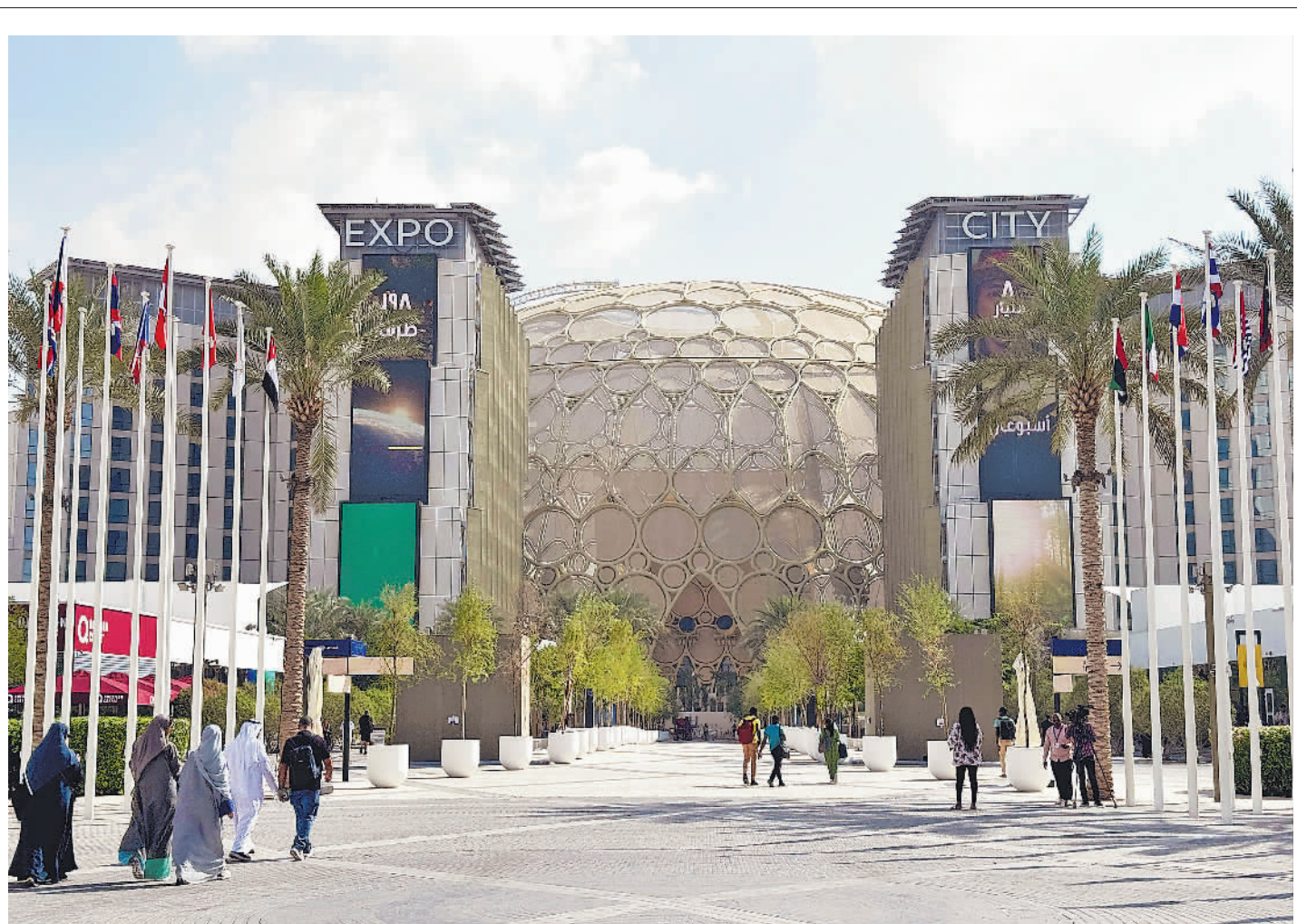
联合国气候变化大会 即将在阿联酋迪拜举行

这是当地时间11月29日在阿联酋迪拜拍摄的联合国气候变化大会举办地迪拜“世博城”。《联合国气候变化框架公约》第二十八次缔约方大会将于11月30日至12月12日在阿联酋迪拜举行。