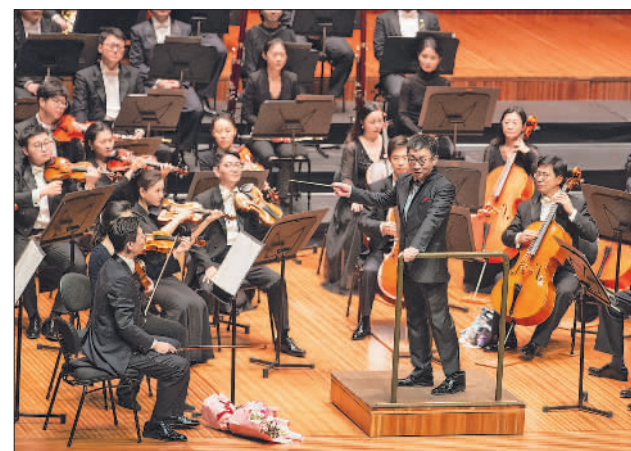
中国交响乐团奏响悉尼歌剧院

当地时间11月28日,中国交响乐团在澳大利亚悉尼歌剧院演出。28日晚,中国交响乐团在澳大利亚悉尼歌剧院为观众带来一场高水平的视听盛宴,共80多名中国音乐家倾情演奏多首中外名曲。