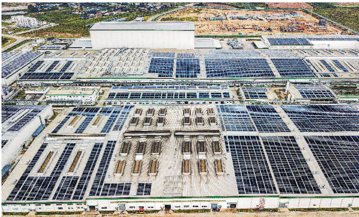
▲这是近日在泰国春武里府拍摄的工厂屋顶光伏发电项目现场(无人机照片)。