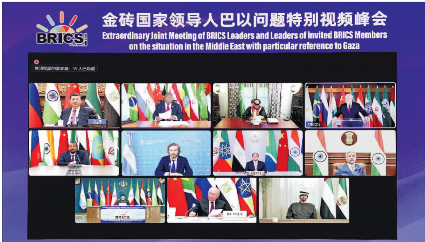
11月21日晚,国家主席习近平出席金砖国家领导人巴以问题特别视频峰会并发表题为《推动停火止战 实现持久和平安全》的重要讲话。

新华社北京11月21日电 11月21日晚,国家主席习近平出席金砖国家领导人巴以问题特别视频峰会并发表题为《推动停火止战 实现持久和平安全》的重要讲话。(讲话全文另发)