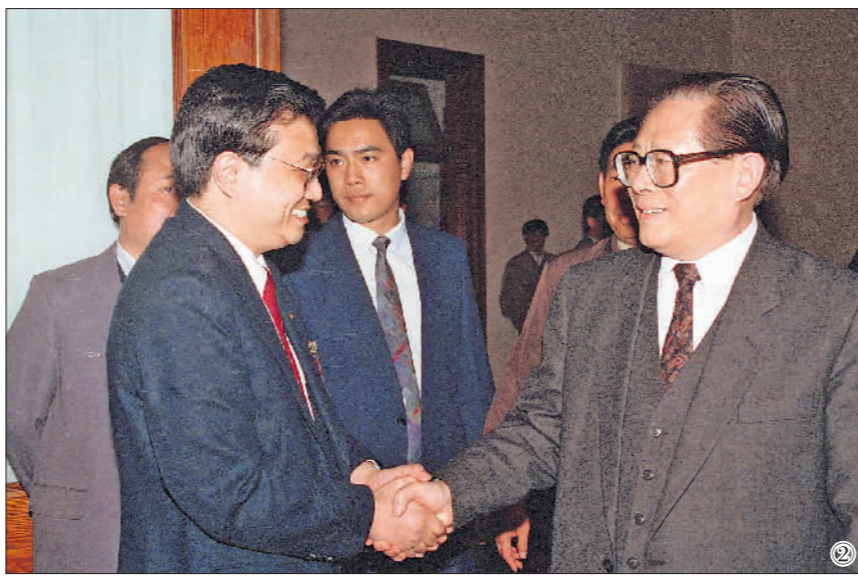
图②:1993年5月3日下午,中国共产主义青年团第十三次全国代表大会在北京人民大会堂开幕。在5月3日上午的预备会议后,举行第一次主席团会议,推选李克强等同志为主席团常务主席。这是江泽民同志与李克强同志握手。