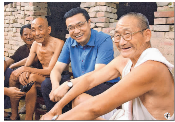
图④:2003年8月8日,李克强同志在河南省新乡市调研。这是李克强同志在原阳县桥北乡马庄村与村民亲切交谈。