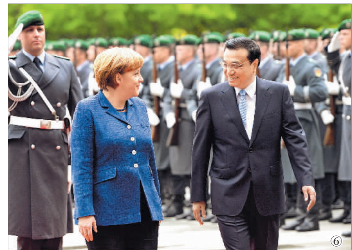
图⑥:2013年5月26日,李克强同志在柏林出席德国总理默克尔举行的欢迎仪式。