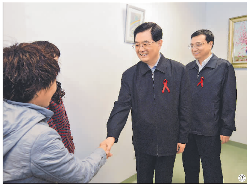
图③:2008年12月1日是第21个世界艾滋病日。胡锦涛同志和李克强同志来到北京地坛医院考察艾滋病防治工作。