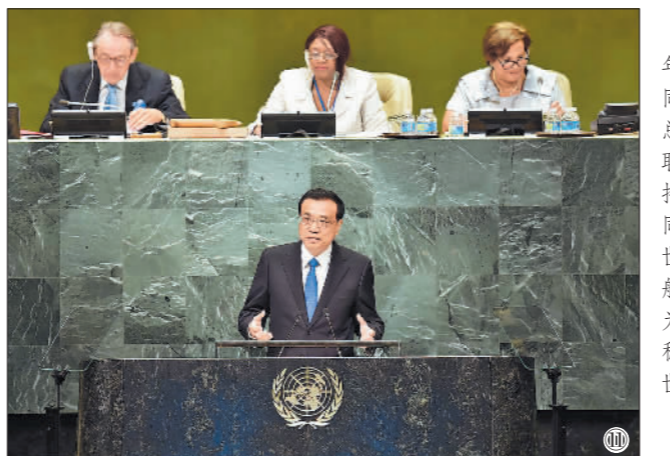
图⑪:2016年9月21日,李克强同志在纽约联合国总部出席第71届联合国大会以“可持续发展目标:共同努力改造我们的世界”为主题的一般性辩论并发表题为《携手建设和平稳定可持续发展的世界》的讲话。