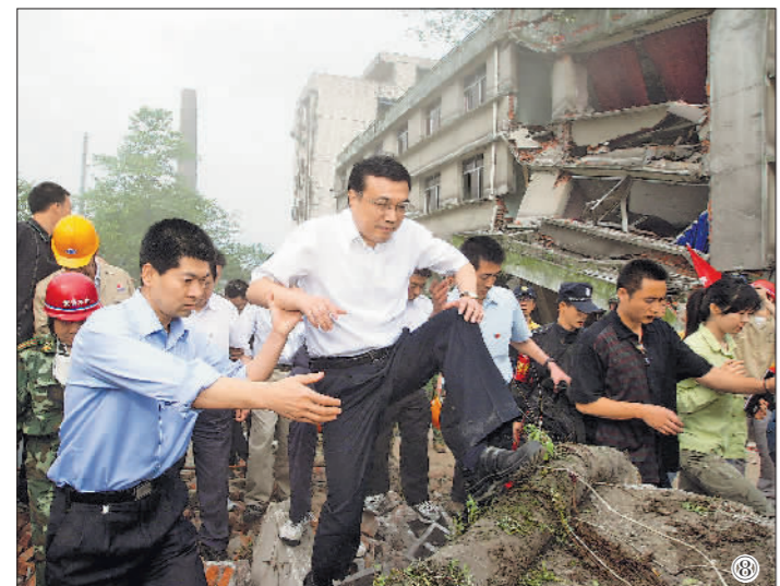
图⑧:2008年5月19日,李克强同志在四川地震灾区察看灾情。