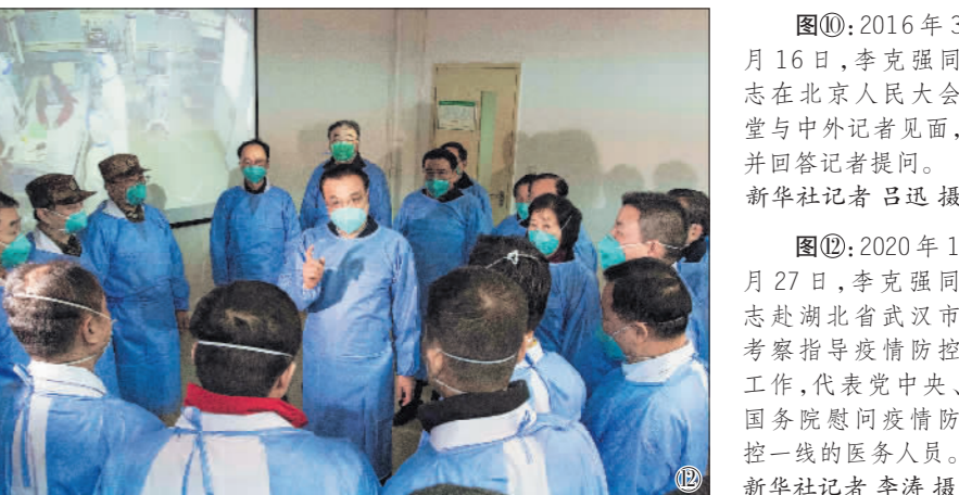
图⑫:2020年1月27日,李克强同志赴湖北省武汉市考察指导疫情防控工作,代表党中央、国务院慰问疫情防控一线的医务人员。