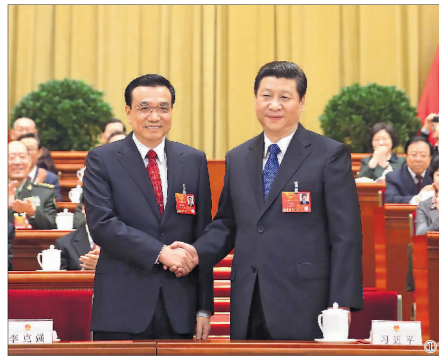
图①:2013年3月15日,第十二届全国人民代表大会第一次会议在北京人民大会堂举行第五次全体会议。会议经过投票表决,决定李克强为中华人民共和国国务院总理。这是习近平同志和李克强同志亲切握手。