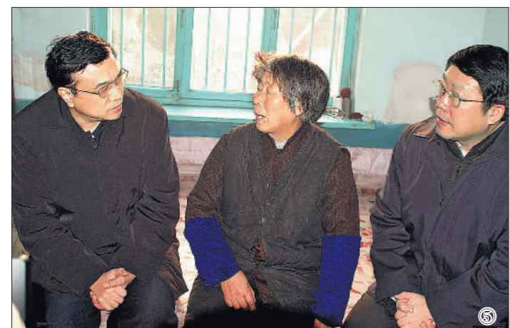
图⑤:2004年12月26日,李克强同志到辽宁省抚顺市莫地沟棚户区居民王淑贞家中走访调研。