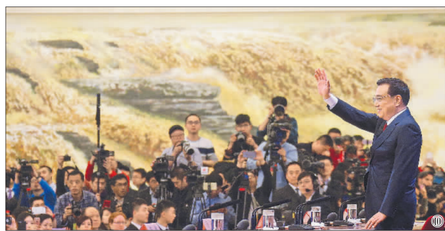
图⑩:2016年3月16日,李克强同志在北京人民大会堂与中外记者见面,并回答记者提问。