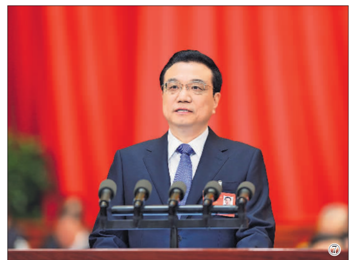
图⑦:2014年3月5日,第十二届全国人民代表大会第二次会议在北京人民大会堂开幕。李克强同志作政府工作报告。