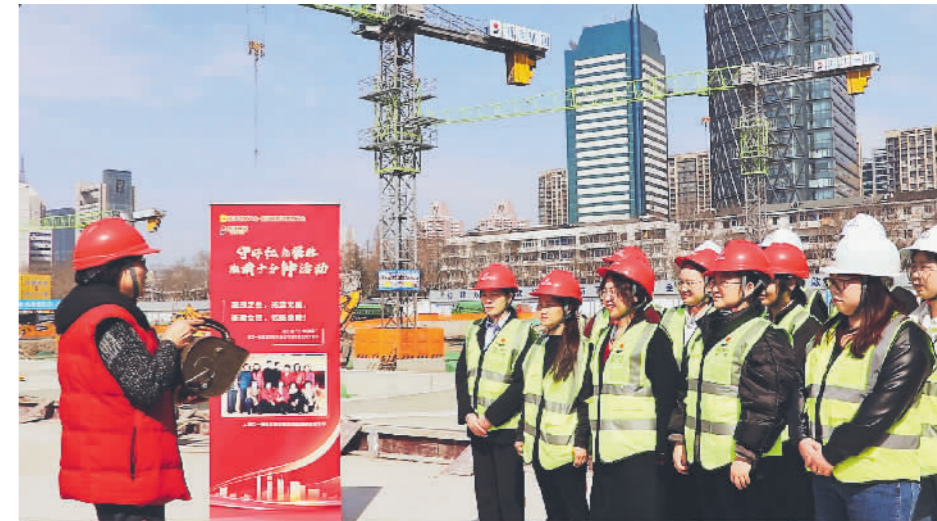
创新开展“守好红色根脉·班前十分钟活动”。