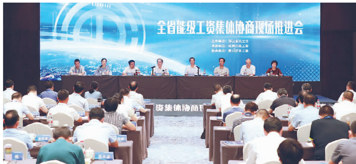
召开全省能级工资集体协商现场推进会。

在浙江,这样温暖的故事还有很多。五年来,浙江工会始终坚持以习近平新时代中国特色社会主义思想为指导,持续提升维权和服务水平。加大源头参与力度,积极参与涉及职工利益